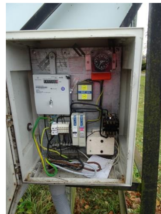
Obr.7 RVO Nová Ves – celkový pohled na elektroměr

RVO Bošovice (blíže neurčeného typu) je umístěn ve skříni na betonovém sloupu společnosti E.ON v části Bošovice u čísla popisného 50.