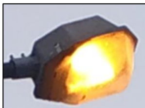
Obr.1 Svítidlo typ 4, 8, 39 (více popisu v tabulkové příloze)