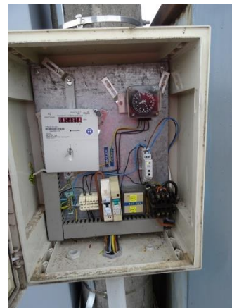
Obr.9 RVO Zlivice obec – lokalizace elektroměru

RVO Zlivice obec (výrobce Itron, ACE1000 Typ 270) je umístěn ve skříni na betonovém sloupu společnosti E.ON v části Zlivice u JZD směrem k číslu popisnému 74.