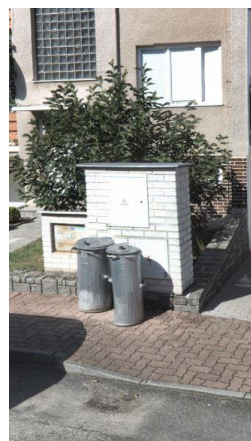
Obr.5 RVO Čížová 68 – lokalizace elektroměru

RVO Čížová 68 (blíže neurčeného typu) je umístěn ve zděném pilíři společnosti E.ON v části Čížová u čísla popisného 68.