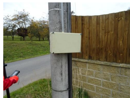
Obr.8 RVO Bošovice – lokalizace elektroměru

RVO Zlivice obec (výrobce Itron, ACE1000 Typ 270) je umístěn ve skříni na betonovém sloupu společnosti E.ON v části Zlivice u JZD směrem k číslu popisnému 74.