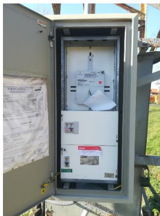
Obr.10 RVO Borečnice – celkový pohled a detail elektroměru

RVO Borečnice (výrobce Itron, ACE1000 Typ 270) je umístěn ve skříni na příhradovém stožáru společnosti E.ON v části Borečnice u čísla popisného 18.