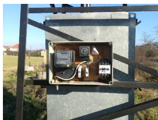
Obr.11 RVO Topělec – celkový pohled a detail elektroměru

RVO Topělec (výrobce ACTARIS, TYPE A49) je umístěn ve skříni na příhradovém stožáru společnosti E.ON v části Topělec u čísla popisného 26.