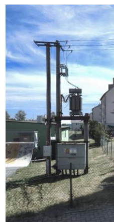
Obr.6 RVO Čížová obec – lokalizace elektroměru

RVO Čížová obec (blíže neurčeného typu) je umístěn ve skříni na příhradovém stožáru společnosti E.ON v části Čížová u čísla popisného 36.