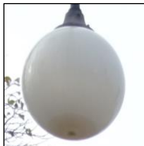
Obr.4 Svítidlo typ 68, 70, 71