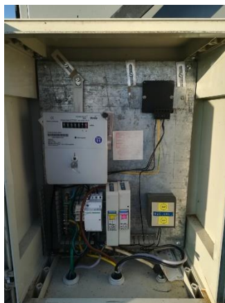
Obr.12 RVO Krašovice – celkový pohled a detail elektroměru

RVO Krašovice (výrobce Itron, ACE1000 Typ 270) je umístěn ve skříni na příhradovém stožáru společnosti E.ON v části Krašovice u čísla popisného 29.